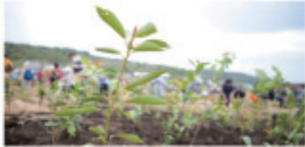
神奈川県「湘南国際村めぐりの森」

ご契約内容はインターネットで24時間365日ご確認いただけます。紙の保険証券発行を省略し、紙の使用量を削減することで、森林資源の保全や地球温暖化防止に貢献することができます。 ※削減された経費の一部は植林プロジェクトに活かされています。